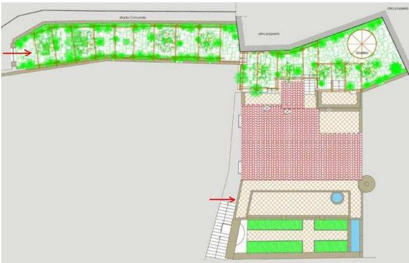
Positano - Salerno - Campania

Tra gli spazi esterni, c'è il giardino pavimentato con la tipica pietra vesuviana, interrotto da aiuole che ospitano le vecchie piante di agrumi, fichi e melograni e nella sua parte terminale si trova il gazebo. L'immobile viene venduto completo di arredi, antiquariato ed Arte.